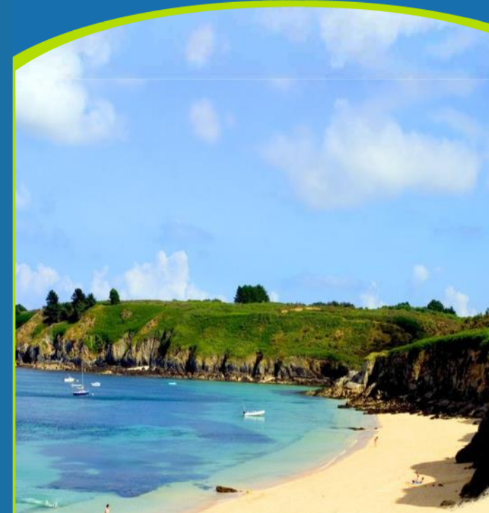
Plage du « gros Rocher situé à 100m du camping

Situé à la pointe du Gros Rocher, à quelques pas de la plage des Grands Sables, à 4 km de Palais, camping de 3000 m2 est habilité par Jeunesse et Sports pour accueillir 30 personnes.